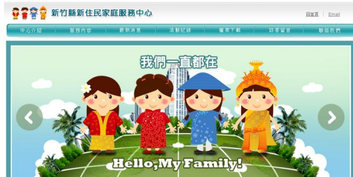
圖片說明:新竹縣新住民家庭服務中心網頁首頁

近年本縣新移民人口數逐年增加，其子女占本縣國中及國小學生數之比率亦佔約1成，惟因跨文化背景，形成相對弱勢族群，為妥善培育新住民子女，本府成立新住民家庭服務中心，進行新住民關懷與訪視，幫助新住民順利融入社會並具備教養兒女的能力，有效發揮家庭教育及親職教育功能。